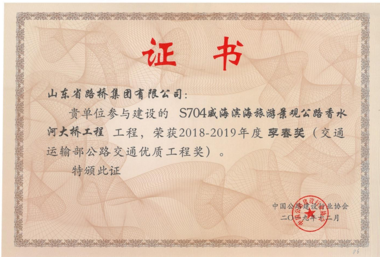
部分参建工程获得荣誉